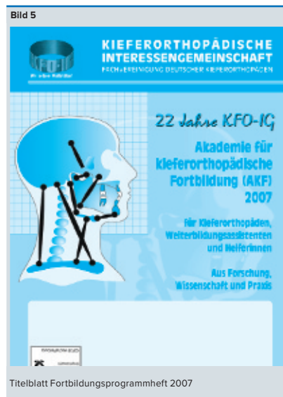
Titelblatt Fortbildungsprogrammheft 2007