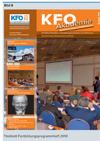
Titelblatt Fortbildungsprogrammheft 2010