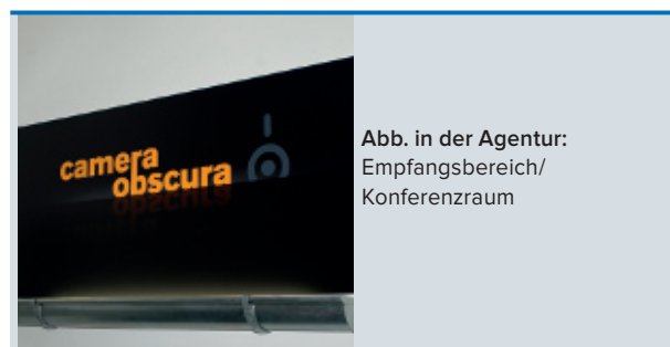
Abb. in der Agentur: Empfangsbereich/ Konferenzraum

Wichtig ist Frequenz und Wiederholung. Wie in der Schule! Dann wird nachhaltig gelernt und die Patienten erinnern sich. Besser noch: sie empfehlen weiter!