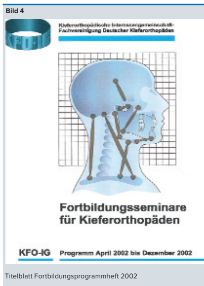
Titelblatt Fortbildungsprogrammheft 2002

Ja. Deshalb muss ich zuerst versuchen, mir ein Bild von der Gesamtsituation zu machen. Am Beispiel Kieferorthopäde ist zunächst mal das Persönlichkeitsbild